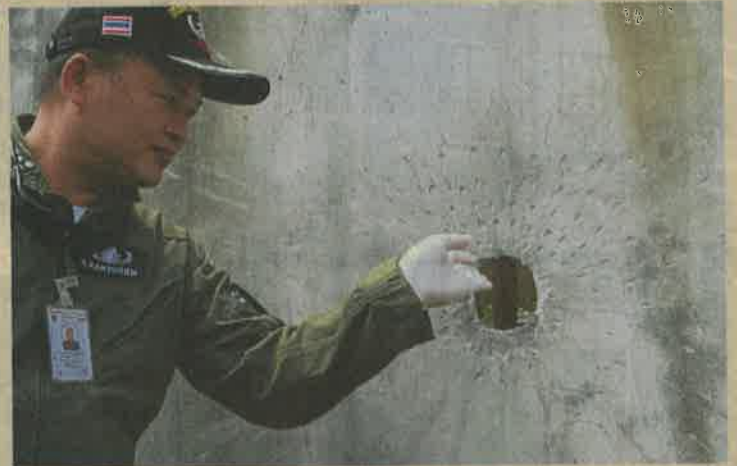
เจ้าหน้าที่ไอโอดีกำลังตรวจระเบิดจากเอ็ม 79 ที่บ้านพักของ นพ.ณรงค์ สหเมธาพัฒน์ ปลัดกระทรวงสาธารณสุข ถนนแจ้งวัฒนะ

ด้าน นพ.ณรงค์ กล่าวว่า ขณะนี้สบายดี ไม่กังวลกับเหตุที่เกิดขึ้น และตนเป็นข้าราชการ ยังคงปฏิบัติราชการตามปกติ เหตุการณ์ที่เกิดขึ้นขอให้สังคมพิจารณาเอาเองว่าเกิดจากเรื่องอะไร โดยไม่ขอพูดถึงเรื่อง