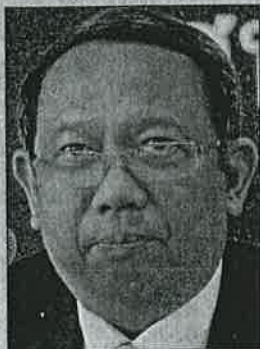
চারিত เห่งดิษฐ์

๐๐ วันที่ 12 พ.ค. ถือว่าเป็นช่วงหัวเลี้ยวหัวต่อสำคัญ ต้องลุ้นว่าการนัดประชุมวาระพิเศษของ ว่าที่ประธานวุฒิสภา สุรัชชัย เลียงบุญเลิศชัย เพื่อคิดหาทางออกให้กับประเทศ แม้ว่าจะยังไม่ชัดเจนว่าจะออกมา