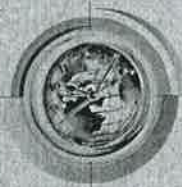
เกาะกระแส

๐๐ เริ่มดีแต่เจ็ดเจ็ดก็กระบอบแล้ว มาตั้งแต่วันที่ 9 พ.ค. สำหรับ มวลชน กบปส. ที่มีร่างทรงคือ กำนันสุเทพ เทือกสุบรรณ มาถึงวันนี้ (12 พ.ค.) ถือว่าผ่านมาสองสามวัน มีการแบ่งมวลชนไปกดดันตามทีวีช่องต่างๆ ให้ทำหน้าที่สมกับเป็นสื่อที่ต้องรู้จักความถูกต้อง ไม่ใช่อย่างแต่เรื่องความเป็นกลาง แต่รับใช้ทุน รับใช้อำนาจรัฐ ดังนั้น