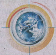
เกาะกระแส

●● นี่ก็เหลืออีกไม่กี่ชั่วโมงก็จะครบกำหนดที่ รอง ปธ. วุฒิสภา ปฏิบัติหน้าที่แทน ปธ.วุฒิสภา สุรชัย เลี้ยงบุญเลิศชัย เคยบอกว่า ขอเวลา 2-3 วัน สำหรับการเสนอ “โรคแมป” ฝ่ายทางต้นประเทศไทย ซึ่งตอนนั้นยังไม่รู้ว่าจะออกมาแบบไหน แต่เมื่อมีการประกาศกฎอัยการศึก ตามมา มันก็เริ่มเดาทิศทาง ได้มากขึ้นว่าแนวโน้มจะไปทางไหน หากเปรียบเทียบเหตุการณ์ในอดีต หากเป็นไปตามนั้น วุฒิสภาก็เหมือนกับ “หอย” ที่ห่อหุ้มด้วย “เปลือกหอย” คือกองทัพในเวลาหนึ่ง เพื่อผลักดันให้ทำหน้าที่ไปตามครรลองประเพณี หรือตามที่ พล.อ.ประยุทธ์ จันทร์โอชา ผบ.ทบ. ได้ตอบคำถามนักข่าวว่า “เวลานี้รัฐบาลอยู่ไหนล่ะ”