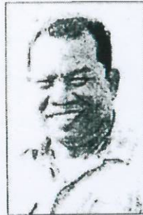
ประสิทธิ์ บุญเคย

เวลาและหาเสียงก่อนการเลือกตั้ง ถึงเวลานี้ ท่านนายก ประสิทธิ์ ยืนยันประกาศชัดเจนว่า“ชาวนาจะมีการรวมตัวเคลื่อนไหวในเรื่องนี้อย่างแน่นอนหลังจากช่วงเทศกาลปีใหม่”...งานใหญ่รอแก้ไขปัญหาแต่เมื่อเห็นป้ายหาเสียงบางพรรคขอโอกาสเดินหน้าทำงานสานต่อนโยบายเดิมให้สำเร็จแล้ว...รู้สึกสะท้อนใจตอนนี้ชาวนาเดือดร้อนไม่ได้รับเงินจํานําข้าว ร้องเพลง“รอ”ก็แล้วยังเจียบหาย ยังไงเสีย ก็อย่าเอาชาวนาไปเป็นตัวประกัน ถ้าไม่เลือกจะไม่มีเงินให้ เพราะถึงวันนี้เขาโดนหลอกมาจากปีนี้อ่าให้ตามไปหลอกหลอนถึงปีหน้าก็แล้วกัน...สงสารชาวนาดกเป็นเหยื่อตลอด...■