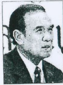
อุทัย พิมพ์ใจชน

■...ว่างเว้นไม่ค่อยได้เห็นบ่อยนักท่ามกลางการเมืองที่ร้อนแรง ในการแสดงความคิดเห็นเพราะเป็นคนที่พูดตรงๆ คนหนึ่ง “อุทัย พิมพ์ใจชน” อดีตประธานสภาผู้แทนราษฎร อดีตกรรมการบริหารพรรคไทยรักไทย ได้แสดงความเห็นชัดเจนว่า ต้องมีการปฏิรูปก่อนเลือกตั้ง แต่ก็ออกตัวว่า “ไม่ใช่ผมเห็นด้วยกับ กปปส.แต่เป็นความคิดเห็นส่วนตัว”...ทันอุทัย ยังให้เหตุผลว่า “วันที่เมื่อทั้ง 2 ฝ่าย ยอมรับว่าบ้านเมืองมีปัญหา ก็ต้องปฏิรูป ทำไมไม่หันหน้ามาร่วมมือกัน”...แล้วยังเห็นว่า “เลือกตั้งไปก็เสียเปล่า มีการต่อต้าน เวลาไปหาเสียง เมื่อเลือกตั้งไปไม่ได้ จะดึงดันไปทำไม”...ที่สำคัญทันอุทัย ยังบอกว่า “ตอนนี้การเมืองมี 2 พวก คือ ราษฎรที่มีตัวตน เป็นของจริง กับ ผู้บริหารพวกนี้ เป็นสิ่งสมมุติ แต่กลับมีการตัดสินใจในสิ่งสมมุติตำแหน่งนายกฯก็เป็นสิ่งสมมุติ”...อย่างไรเสีย ยังแนะว่า “อย่าไปยึดติด ออกแล้วสงบ ก็ออกไปเถอะ คนที่จะแก้ไขปัญหาได้ คือ นายกฯเท่านั้นว่าจะให้บ้านเมืองเกิดกลียุคหรือไม่ ถ้ารักษาตำแหน่งไว้กลียุคแน่ ต้องดูพระบาทสมเด็จพระปกเกล้าเจ้าอยู่หัว เป็นตัวอย่าง ตำแหน่งกษัตริย์ท่านยังสละได้”...แหม..ทั้งท้ายยกตัวอย่างให้เห็นชัดๆอย่างนี้ไม่รู้ว่าจะคิดได้หรือเปล่า หากไม่รู้จักเสียสละ หากเกิดเหตุนองเลือด จะรับผิดชอบไหม...■