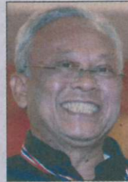
สุเทพ เทือกสุบรรณ

●● นั่นเป็นสภาพความเป็นไป ที่รัฐบาลทหาร ระบอบทักษิณ กำลังดิ้นรนเหือกสุดท้าย เพราะยิ่งนานไป มีแต่คนรังเกียจ ไม่มีใคร เล่นด้วย เอาเป็นว่าเวลานี้ลองไปถามคนเสื้อแดง รวมทั้งชาวบ้านรากหญ้าในภาพเหนือ ภาคอีสาน ว่ายังหลงใหลได้ปลื้มกับครอบครัว ทักษิณ ยังชมชอบผลงานของ ยิ่งลักษณ์ ชินวัตร เหลือสักกี่คน ทุกอย่างเกิดจาก “ผลประโยชน์” อยู่ตรงหน้า เดือดร้อนจาก “ของแพง”