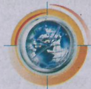
เกาะกระแส