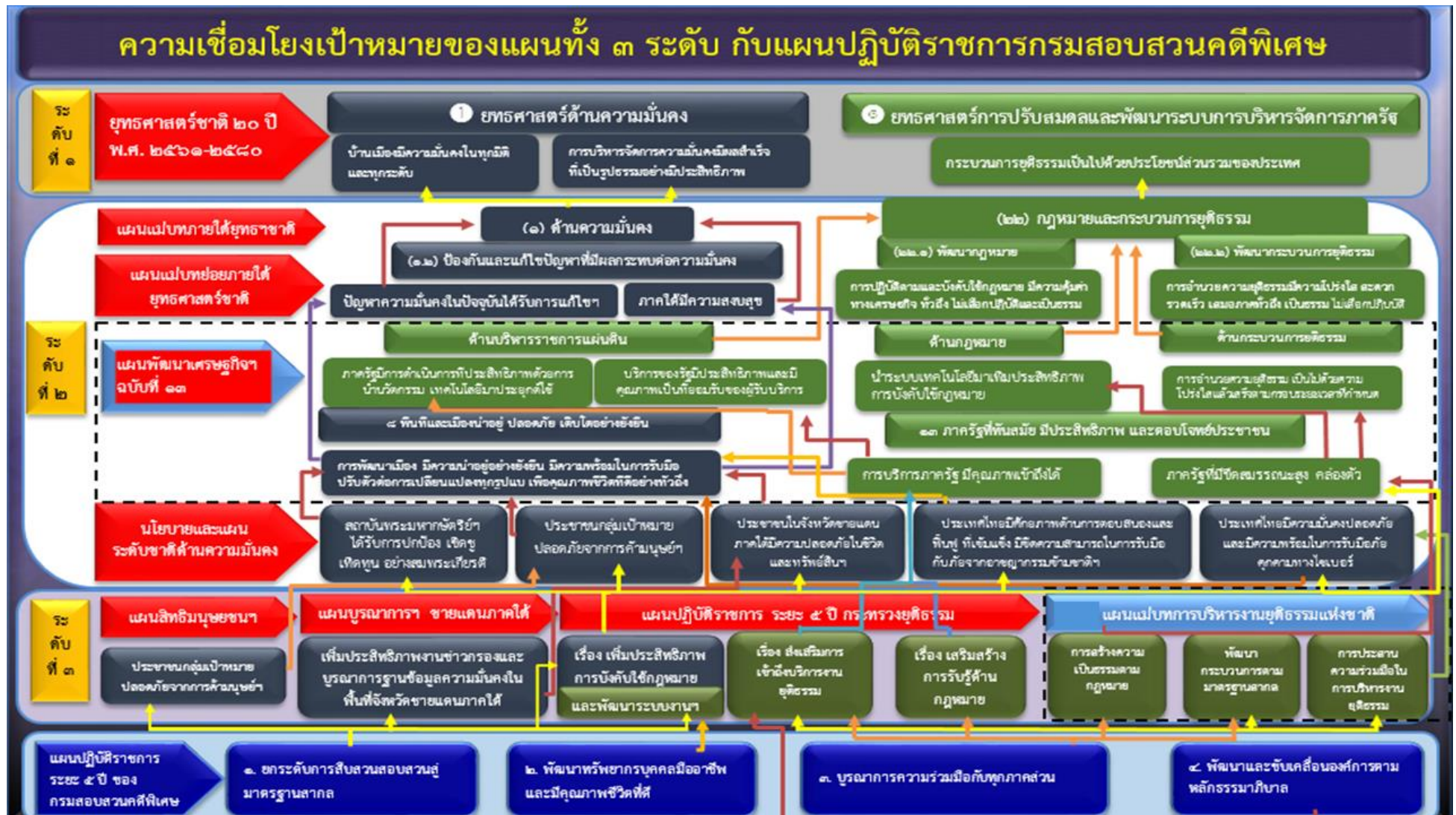
แผนภาพที่ ๑ : ความเชื่อมโยงเป้าหมายของแผนทั้ง ๓ ระดับกับแผนปฏิบัติการการกรมสอบสวนคดีพิเศษ