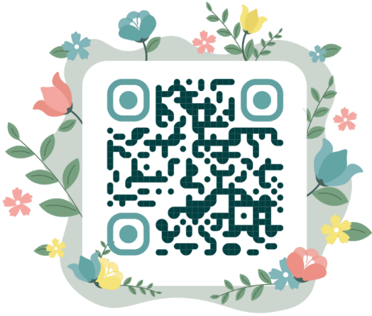
สำหรับมือถือ iPhone