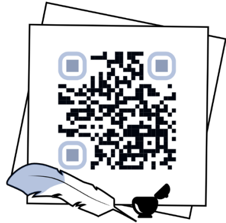
สำหรับมือถือ Android